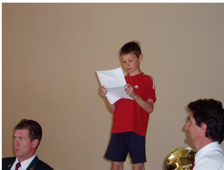
Commémoration du 8 mai

Tous les conseillers en exercice sont à même de répondre à vos interrogations sur ces chiffres.